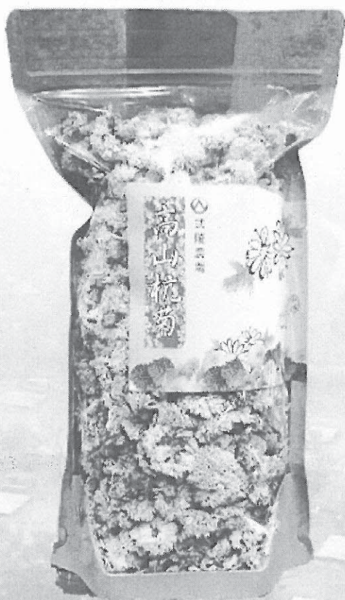
黃杭菊100g (袋裝) $NT700