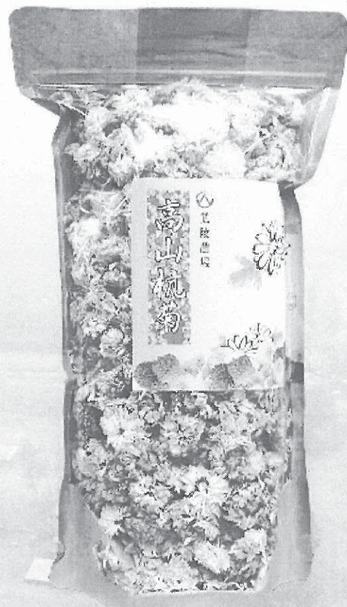
白杭菊100g (袋裝) $NT600