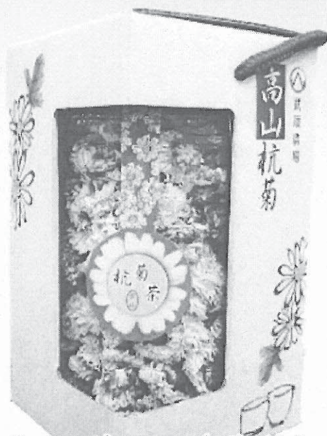
黃杭菊50g (罐裝) $NT500