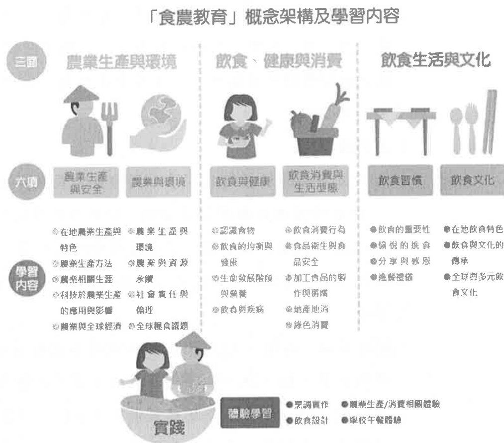
表 1 食農教育推廣架構

「食農教育推廣架構」(表 1) 為本計畫食農教育活動規劃及教案設計之指引參考，以協助各申請單位聚焦推動食農教育，並銜接學校相關之領域課程。除規劃及執行食農教育的課程教案與活動，各申請單位尚須辦理內部訓練，並參與本計畫辦理之培訓及接受評核，以累積推廣能量。