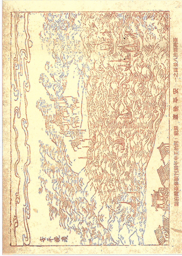
《臺南文化》創刊號刊登的臺灣郡治八景圖之「安平晚渡」。

1976年復刊後的新《臺南文化》，撰稿群日益擴大，社會類和政事類的文章比例也因運增加，之後由於縣市合併之故，市府文化局於2022年將原有市、縣出版的《臺南文化》與《南瀛文獻》刊物，合併為《臺南文獻》，比照學術雜誌、學報方式，每期針對主題徵稿，以半年刊型態發行，長期、廣泛與深入的關注與探討大臺南種種文化議題。