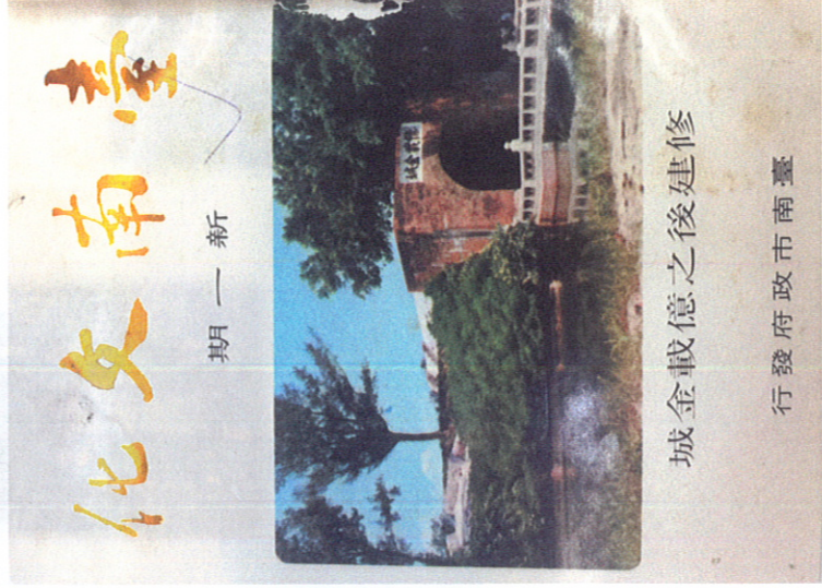
城金載憶之後建修 行發府政市南臺