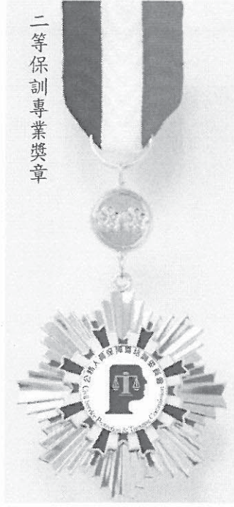
二等保訓專業獎章