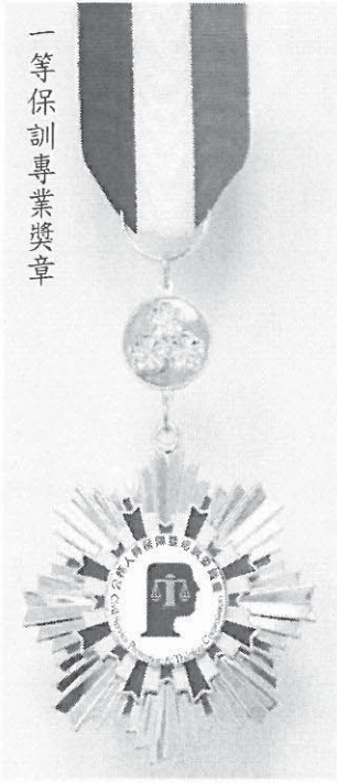
一等保訓專業獎章