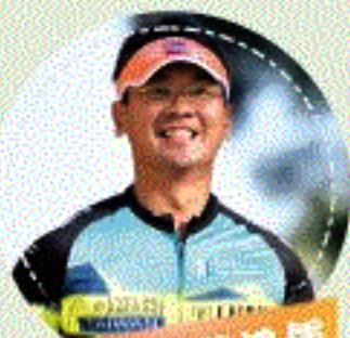
仁德文賢國中-黃鴻話