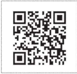
「外交部領事事務局－為民服務白皮書」QR Code