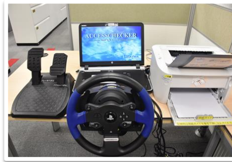
駕駛性向診斷模擬機

明台產險將於板橋、彰化、屏東各舉辦一場「安全駕駛體驗營」，讓各校司機親自體驗「安全駕駛危險預測情境訓練」及「駕駛性向診斷模擬機」，屆時熱烈歡迎全國校園公車司機踴躍參加(每場次上限20人)。各場次舉辦時間及地點如下：