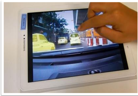
安全駕駛危險預測情境訓練

為減少交通事故的發生，除了駕駛人有優良的駕駛技術之外，更重要的是從觀念態度中培養駕駛人對於「安全駕駛」的認知與行為，明台產險特別從日本三井住友海上集團的風險顧問公司導入在日本深獲好評的「安全駕駛危險預測情境訓練」及「駕駛性向診斷模擬機」。透過「安全駕駛危險預測情境訓練」深入瞭解身為駕駛可能面臨的各項風險情境，例如仔細觀察周遭路況判別潛在風險、掌握路上行人及機慢車的特性、瞭解天氣的潛在風險以及掌握風險後的接下來行動對策。透過「駕駛性向診斷模擬機」進行全方位的診斷，包含單純反應診斷、選擇反應診斷、方向盤操作診斷及注意力分配診斷，最後評估駕駛員在同職場中及同年齡族群中的表現結果。