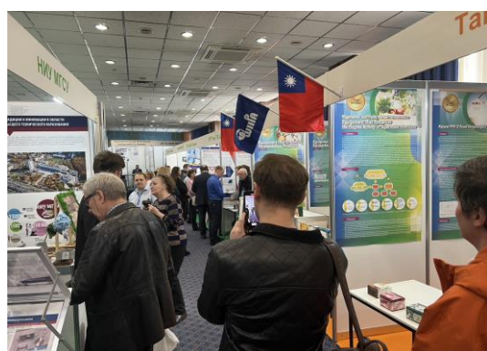
▲ 主辦單位特地為 WIIPA 與 TIPPA 團隊安排在最明顯的國際展區